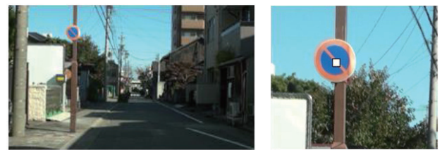
(a)車載カメラ映像 (b)注目部分